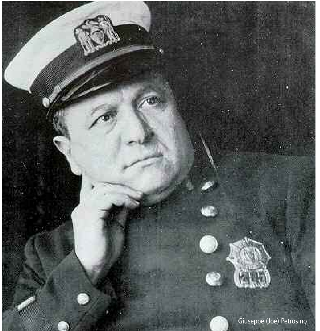
Giuseppe (Joe) Petrosino

grato, che non era diventato un delinquente o un pazzo, era da considerarsi un santo. Strappare un essere umano dalla società contadina nella quale era cresciuto - sosteneva lo scrittore che visse per lunghi anni in America - era riconosciuto da tutti gli psicologi come una delle più gravi difficoltà per uno sviluppo normale. Quando il bastimento arrivava a New York l'immigrante era disorientato, sbalordito e doveva trovare subito un'occupazione a qualunque costo e condizione. Si creò allora in America un'opinione preconstituita sull'immigrato italiano. La rappresentazione classica lo vedeva "come un ometto dal colorito terragnolo, basso e malvestito, come un paio di baffoni neri cascanti all'ingù, che porta in giro l'organetto, che