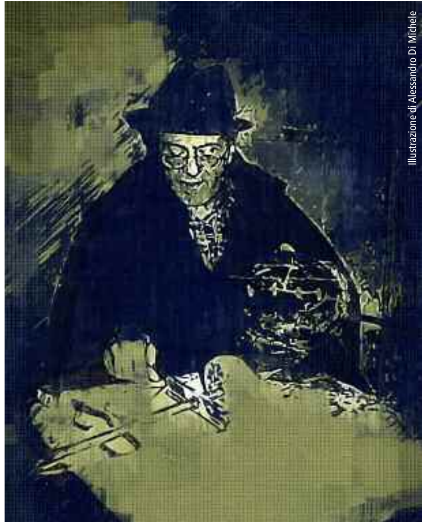
Illustrazione di Alessandro Di Michele

Attualmente il Museo a Castiglione a Casauria può mostrare oltre trecento antichi trapani mentre la cittadina di Secinaro continua a detenere il "primato d'amore" nel tramandare i mille mestieri che sono la nostra storia.